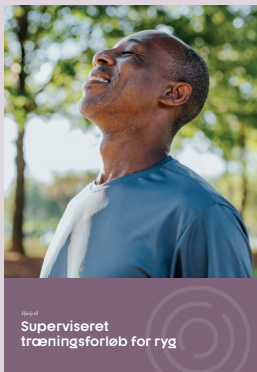
Superviseret træningsforløb for ryg

Forundersøgelse, 2 statuskonsultationer efter 2 og 8 uger samt evt. mellemliggende konsultationer ved behov.