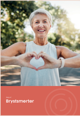
Udredningsforløb ved brystmerter